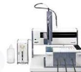
GILSON Aspec GX-274

Fases para Clean-up de amostra como Extração Líquido-Líquido (LLE) ou Extração em Fase Sólida (SPE) podem ser utilizadas