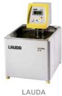
LAUDA Banho Alpha A12

Centrifugação para a precipitação da fase sólida e coleta da solução sobrenadante