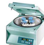
HETTICH - Rotofix 32A