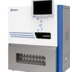
REEKO Auto EVA-60