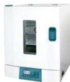
JEIO TECH - OF12P

Extração das drogas por aquecimento em estufa ou banho termostático