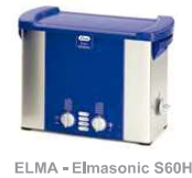
ELMA - Elmasonic S60H

Lavagem do cabelo: a descontaminação deve ser realizada previamente à análise para a eliminação de possíveis interferentes. É necessário a remoção de contaminantes externos depositados na superfície do cabelo e possíveis resíduos de produtos para tratamento capilar