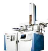
THERMO - TSQ 8000 EVO