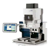
METTLER TOLEDO BenchSmart 96