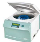
HETTICH - Universal 320

Centrifugação para a precipitação da fase sólida e coleta da solução sobrenadante