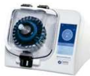
OMNI - BeadRuptor 24 Elite

Pulverização: a amostra de cabelo deve ser pulverizada a seco para o aumento da superfície de contato. A extração de forma simultânea poderá ser feita com a adição do solvente ao processo de pulverização