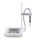
METTLER TOLEDO Five Easy 20

Pulverização: a amostra de cabelo deve ser pulverizada a seco para o aumento da superfície de contato. A extração de forma simultânea poderá ser feita com a adição do solvente ao processo de pulverização